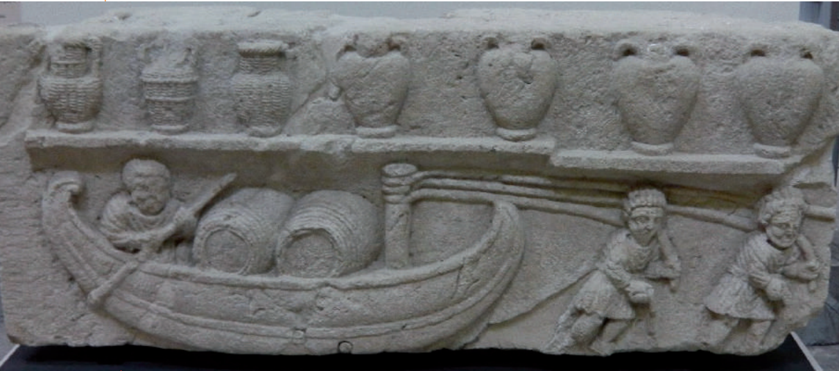
■ La première représentation connue de tonneaux, invention gauloise. Bas-relief de Cabrières-d'Aigues.